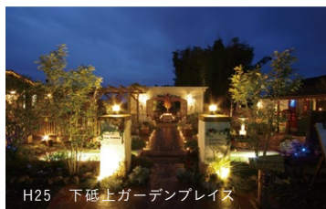
H25 下砦上ガーデンプレイス