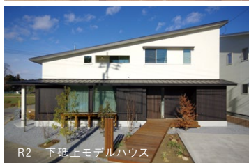
R2 下砦上モデルハウス