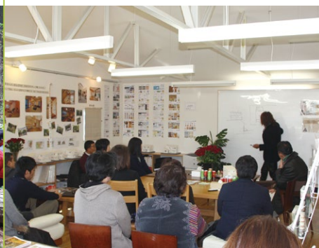
相談会・セミナー