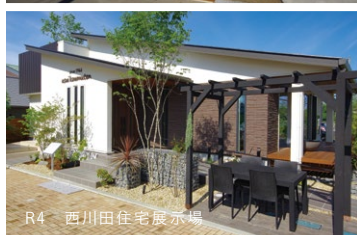
R4 西川田住宅展示場